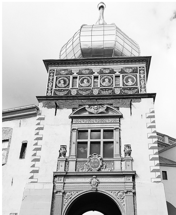
Рис. 7. Ворота Старого замка после завершения реконструкции. Фото Н. Волкова, 2021 г.

Согласно проекту В. Бачкова, оборонительный характер получила дополнительная галерея между воротами и дворцом, возведенная в первой половине XVII в. Эта идея также принадлежит Я. Войтеховскому, который назвал галерею «барбаканом» и считал, что весь замок времен Батория был оборонительным сооружением 24 . Однако это не соответствует действительности, поскольку после перестройки в конце XVI в. резиденция стала «открытой». Определенные оборонительные приспособления (ров, ворота с герсой и подъемным мостом) создавали иллюзию защищенности, что было характерно