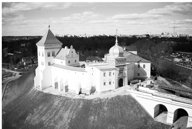
Рис. 6. Старый замок после завершения первой очереди реконструкции. Фото С. Плыткевича, 2021 г.

На примере воротной башни и галереи, ведущей от башни к дворцу, а также в ряде других случаев, речь о которых пойдет ниже, хорошо видно стремление архитекторов «нарастить» архитектурные объемы и тем самым сделать резиденционный комплекс