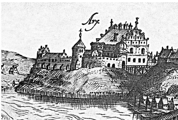
Рис. 1. Гродно, Старый замок.

На исключительность Старого замка как архитектурного памятника указывает его сравнение с королевскими замками в столицах соседних государств — Варшаве и Вильнюсе. Во-первых, гродненская резиденция во многом сохранилась как аутентичный объект (в перестроенном виде сохранились ворота и дворец), в то время как варшавский и вильнюсский