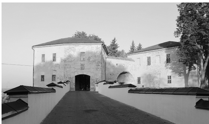
Рис. 5. Ворота и дворец Старого замка. 2015 г.

с тем спроектировал дополнительный этаж с открытой балюстрадой на галерее, соединяющей воротную башню с дворцом. Научное обоснование решения отсутствует. Но указание на мотив, которым руководствовался архитектор, можно найти в статье 2013 г.: «Завершаются галереи террасой, огороженной балюстрадой — прекрасным местом для прогулок и созерцания