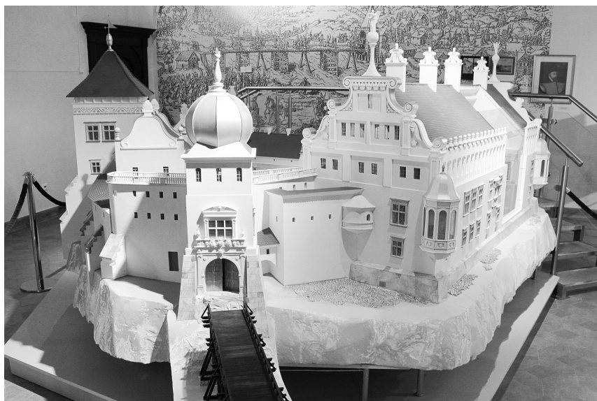
Рис. 4. Реконструкция Старого замка конца XVI в. Макет, изготовленный на основе эскизного проекта В. Бачкова. Экспозиция в Мирском замке. Фото Н. Волкова, 2011 г.

По итогам изучения Старого замка во второй половине 1980-х – начале 1990-х гг. были предложены два варианта реконструкции памятника. Согласно первому, следовало восстановить разные части комплекса, соответствующие древнерусскому, готическому