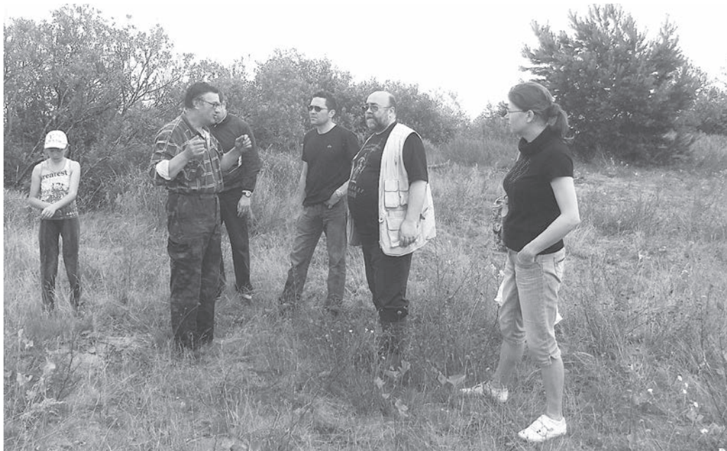
Остров Сиговец. Экспедиция кафедры исторического регионоведения. 2013 г.

Результаты, полученные во время проводившихся под началом Г. Н. Караева работ, были в сжатом виде опубликованы 10 , хотя большая часть материалов до сей